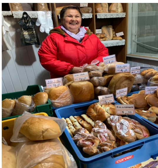
Brood uit eigen bakkerij