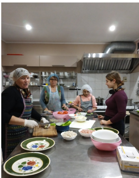
Eten klaarmaken in de keuken