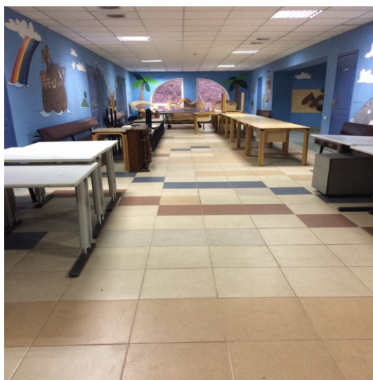
Nieuwe meubels in het kinderhuis