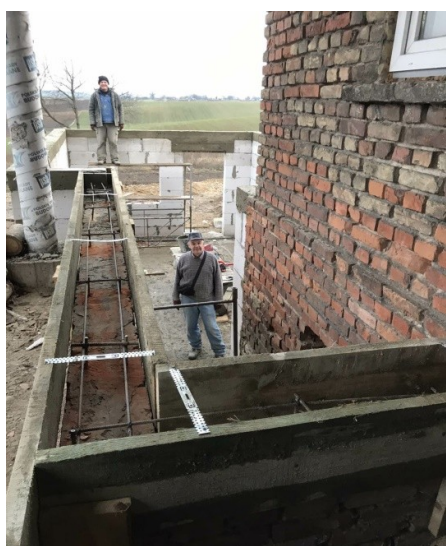
Nieuwbouw bij het vrouwenhuis